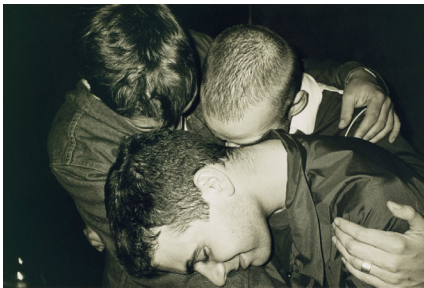
Wolfgang Tillmans: Arkadia I

Dazu besuchen wir Ausstellungen zeitgenössischer Kunst, um die eigene Arbeit in einen größeren Zusammenhang zu stellen. Diese Ausflüge erfordern etwas zeitliche Flexibilität und persönliche Motivation.