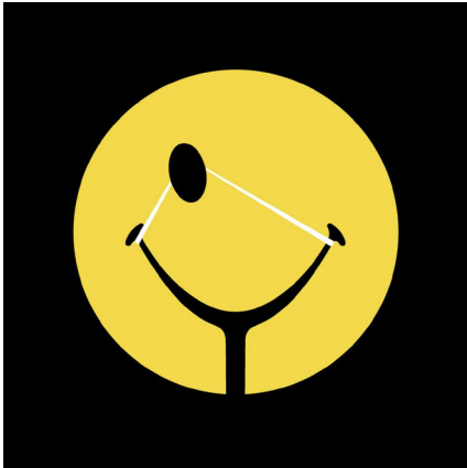
Noma Bar: World Smile Day

Du zeichnest, fotografierst, baust, experimentierst – oder du weißt noch gar nicht, was du eigentlich willst? Dann bist du hier richtig.